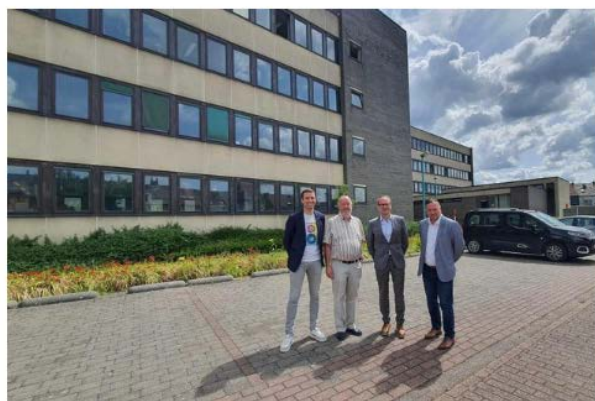
Dit gebouw van het vrederecht en de politierechtbank wordt verbouwd tot rechts een school en links een zorggebouw met onder meer kinderopvang.

HALLE - Er staan grote veranderingen op til in Halle. De Vlaamse overheid zit in de laatste rechte lijn om het gebouw van het vrederecht en de politierechtbank aan te kopen en hier een nieuwe zorg- en onderwijscampus van zo'n 5.000 m 2 te creëren. Er komt een nieuwe school voor 340 kinderen, een kinderdagverblijf en lokalen voor consultaties en dagbesteding in de sector van de geestelijke gezondheidszorg.